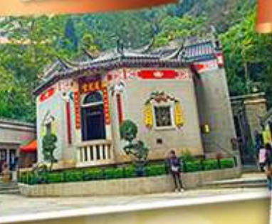
องค์อ้อยส้ม