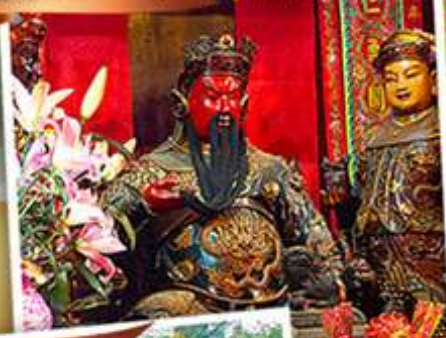
วัดหลินฟาง